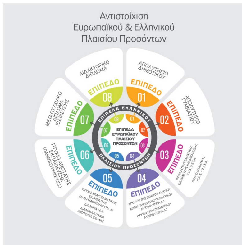
Πίνακας 1. Τύποι Προσόντων

Τα επίπεδα των τίτλων σπουδών που χορηγούν τα ελληνικά εκπαιδευτικά ιδρύματα και η αντιστοίχισή τους με το Ευρωπαϊκό Πλαίσιο Προσόντων είναι τα παρακάτω: